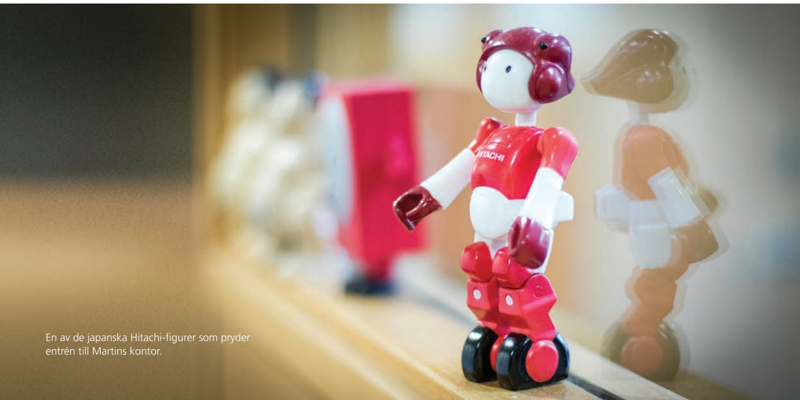
En av de japanska Hitachi-figurer som pryder entrén till Martins kontor.