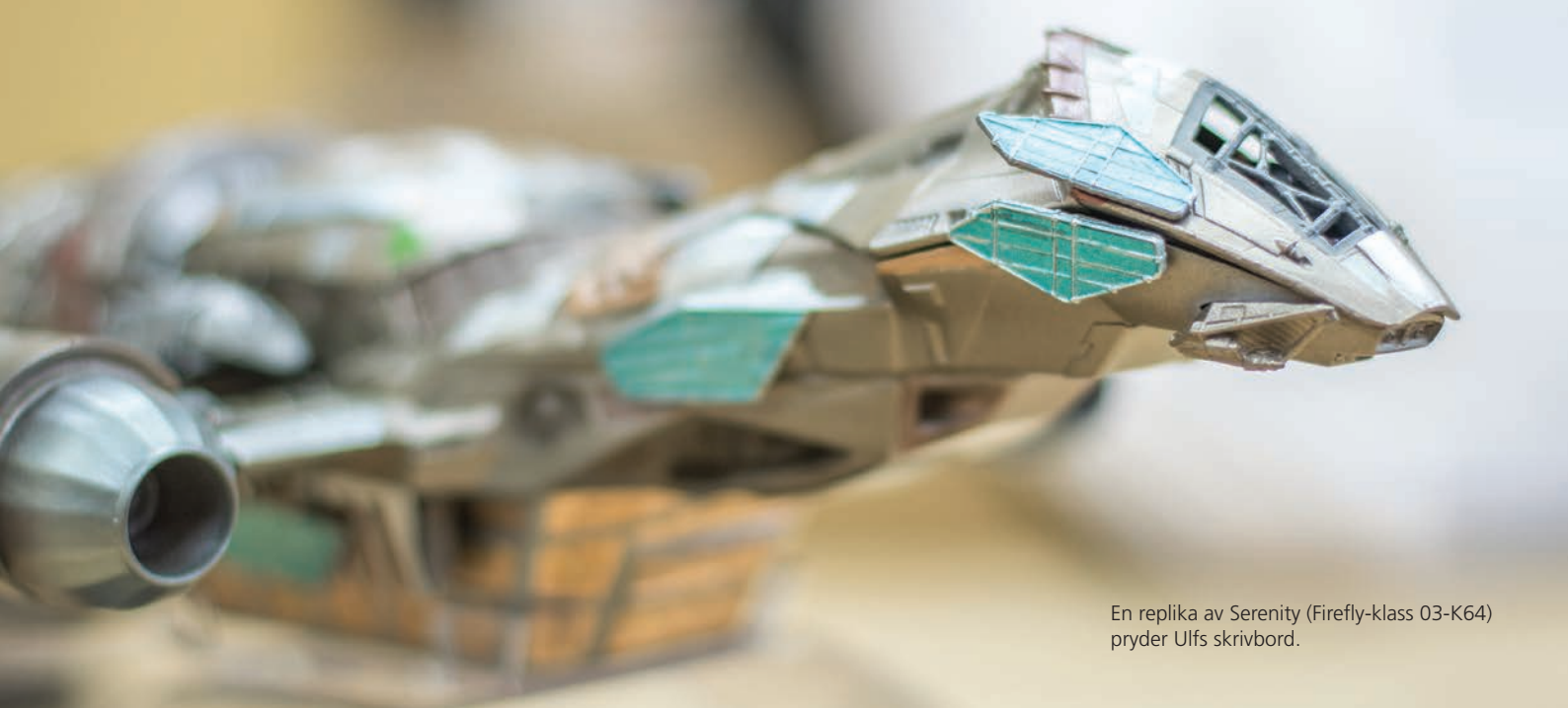
En replika av Serenity (Firefly-klass 03-K64) pryder Ulfs skrivbord.